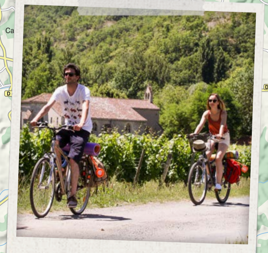
À VÉLO DANS LES VIGNES