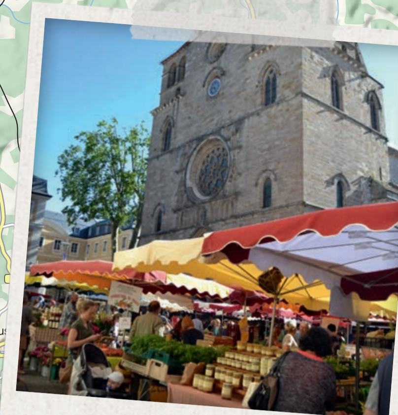
MARCHÉS DE CAHORS

HÉBERGEMENTS ACCUEIL VÉLO LE VALENTY CAMPING A LA FERME *** Valenty - 46700 SOTURAC 06 88 10 78 55 www.le-valenty.jimdo.com LE CLOS DE LA SALAMANDRE CHAMBRES D'HÔTES Route de Vire - 46700 DURAVEL 06 10 56 94 06 www.le-clos-de-la-salamandre.fr BELLEVEUE HOTEL-RESTAURANT *** Place de la Truffière 46700 PUY L'ÉVÊQUE 05 65 36 06 60 www.hotelbelleveue.puyleveque.com BASE NAUTIQUE FLOIRAS CAMPING 46140 ANGLARS-JUILLAC 05 65 36 27 39 / 06 32 59 80 96 www.campingfloiras.com LES BOIS DE PRAYSSAC VILLAGE VACANCES *** Route Sœur Marguerite Meynen 46220 PRAYSSAC 05 65 35 65 22 www.village-vacances-lesboisdepraysac.fr LA TERRASSE FLEURIE GÎTE ET CHAMBRES D'HÔTES 46220 PRAYSSAC 05 65 22 18 48 / 06 78 24 64 19 www.chambres-hotels-la-terrasse-fleurie-praysac_43472.htm DOMAINE DU PEYROU GÎTE ET CHAMBRES D'HÔTES 46140 LUZECH 05 65 30 51 98 / 06 33 77 95 16 www.lespeyrou.com LA BERGERIE / GÎTE 46140 LUZECH 05 65 20 10 76 / 06 72 99 39 19 www.gite-luzech-lot.fr L'OPPIDUM GÎTE D'ÉTAPE 46140 LUZECH 05 65 30 72 32 / www.ville-luzech.fr LE CHAI AUBERGE DE JEUNESSE 46000 CAHORS 05 36 04 00 80 / www.hfrance.org Ajouter nouvel hébergement: BRIT HOTEL *** & **** 46000 CAHORS 05 65 35 16 76 cahors-france.brithotel.fr cahors-valenty.brithotel.fr DIVONA BEST WESTERN HOTEL **** 46000 CAHORS 05 65 21 18 39 / www.hoteldivona.fr