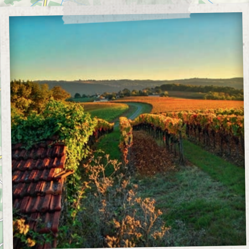
VIGNOBLE DE CAHORS EN AUTOMNE