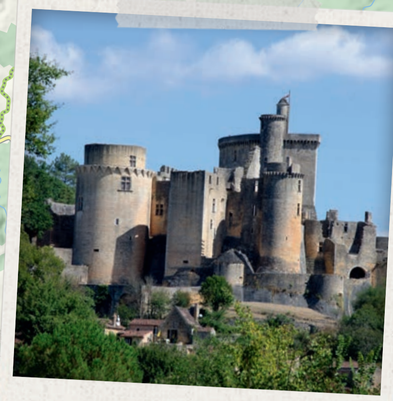
CHÂTEAU DE BONAGUIL