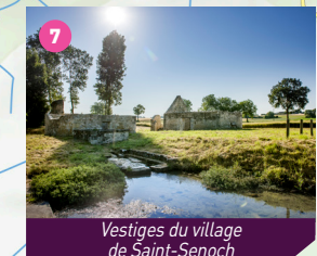
Château de Saint-Senoch, xviii e siècle