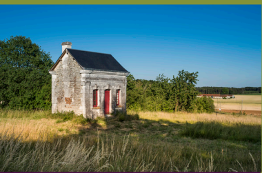
Loge de vigne, XIX e siècle