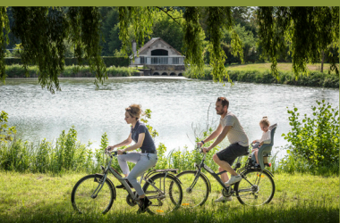
Plan d'eau de Ciran