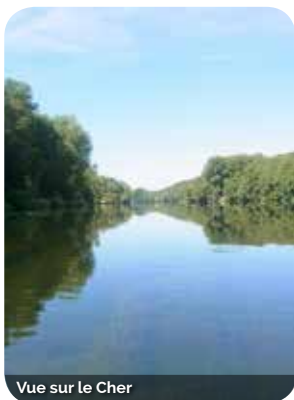
Vue sur le Cher