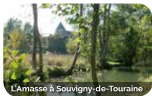
L'Amasse à Souvigny-de-Touraine