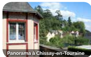
Panorama à Chissay-en-Touraine