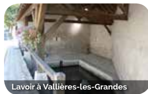
Lavoir à Vallières-Les-Grandes