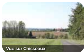
Vue sur Chisseaux