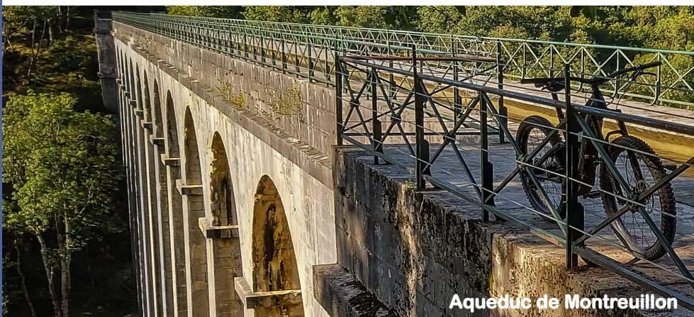
Aqueduc de Montreuillon